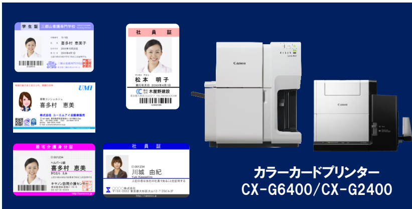
カラーカードプリンター CX-G6400/CX-G2400

キヤノン カラーカードプリンター CX-G6400/CX-G2400の印字サンプルを ぜひ手に取って、その印字品位を実感 してください！