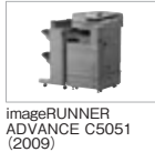
imageRUNNER ADVANCE C5051 (2009)