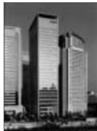
キヤノン S タワー (2003)