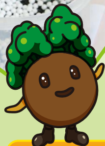
キャンノン エコアンバサダー 土男