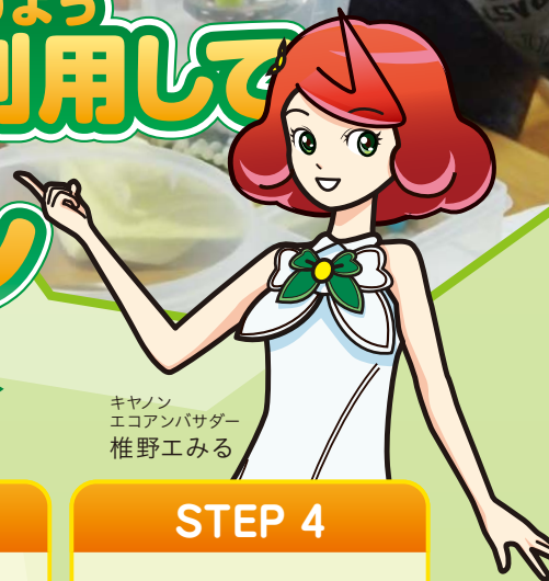
キャンノン エコアンバサダー 椎野みくる