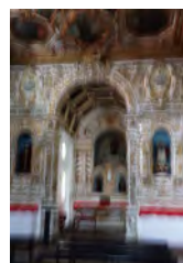
コンビネーションIS OFF