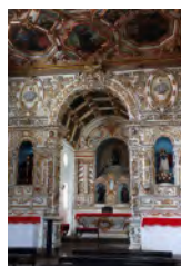
コンビネーションIS ON