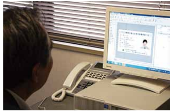
オプションソフト「ImageCreate SE」により、簡単な操作で思い通りのカードデザインが可能

するようすを見せてくれた。また、プラスチックカードだけでなく紙のカードにも印刷できるので、今後は職員の名刺印刷も内製化して、名刺印刷コストの削減もはかっていきたいという。今やプラスチックカードは財布の中にも何枚も取まり、毎日の暮らしになくてはならないものになっている。利便性とデザイン性を考えれば、講習の修了証をプラスチックカードにすることは必然の流れ。コストとスピードを兼ね備えながら、受講者に喜ばれる修了証を発行できるキヤノンのカラーカードプリンターは、これからの安全教育にいっそうの付加価値を与えてくれることだろう。