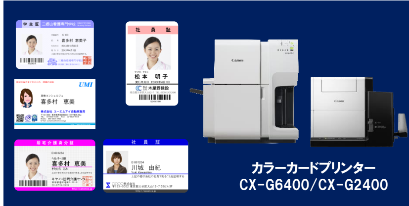
カラーカードプリンター CX-G6400/CX-G2400

キヤノン カラーカードプリンター CX-G6400/CX-G2400の印字サンプルを ぜひ手に取って、その印字品位を実感 してください！