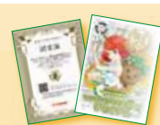
▲キャノンエコマスター認定証

※ 授業を受講し、分別実験に参加された記念に、「キャノンエコマスター」認定証をお渡しします。