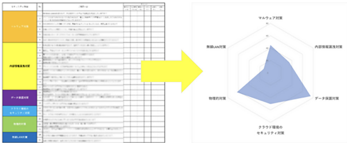
セキュリティチェックシート