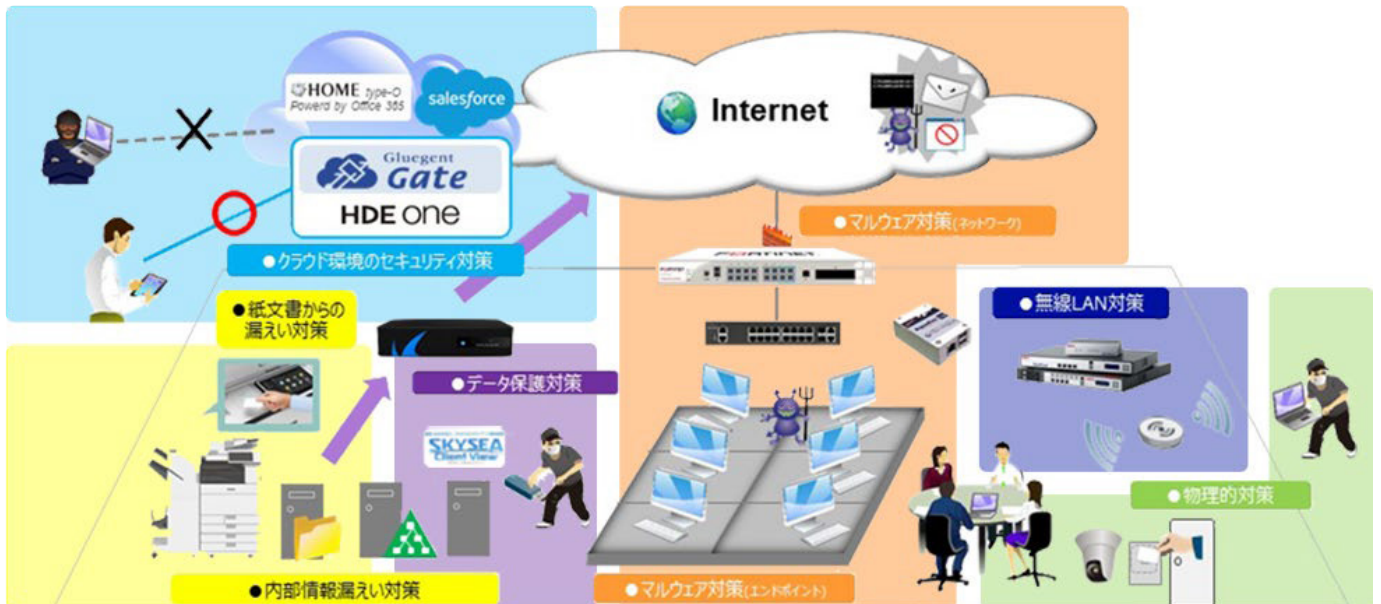
セキュリティソリューションマップ

キヤノンマーケティングジャパングループは、キヤノンの数多くのお客さまとのかかわりや長年にわたり培ってきた経験やノウハウをもとに、お客さまの抱える潜在的な課題をみえる化し、中堅・中小企業に最適なセキュリティソリューションを提案してきました。全国に広がる営業/サポート網を活用し、導入から運用までの提案、充実したサポートを提供します。