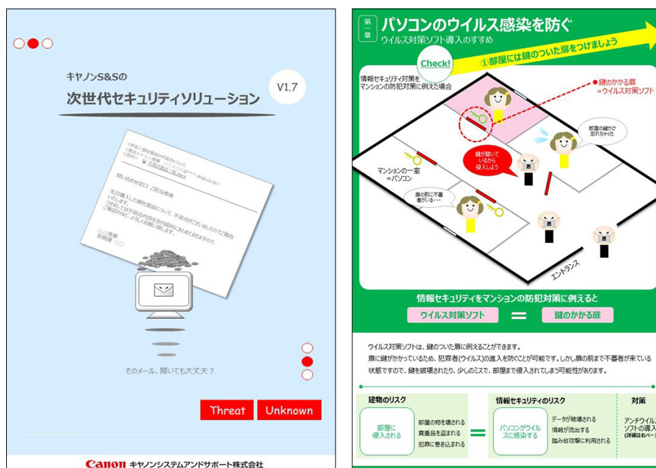
キャノンマーケティングジャパングループが提供している「次世代セキュリティソリューション」小冊子

このほか、セキュリティ製品の機能や仕組みをわかりやすく紹介した小冊子なども用意しているので、「どのようなセキュリティ対策が必要か」「実際にどのような防御が行われるのか」を十分に理解した上でのセキュリティソリューション導入が可能です。