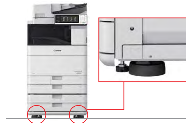
※上記は、iR-ADV C5535に装着した場合。

※神戸波形(震度7相当)を縮小した波形(震度6強相当)で効果を確認。 「長周期地震動」には対応しておりません。