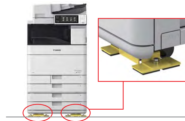
※上記は、iR-ADV C5535に装着した場合。